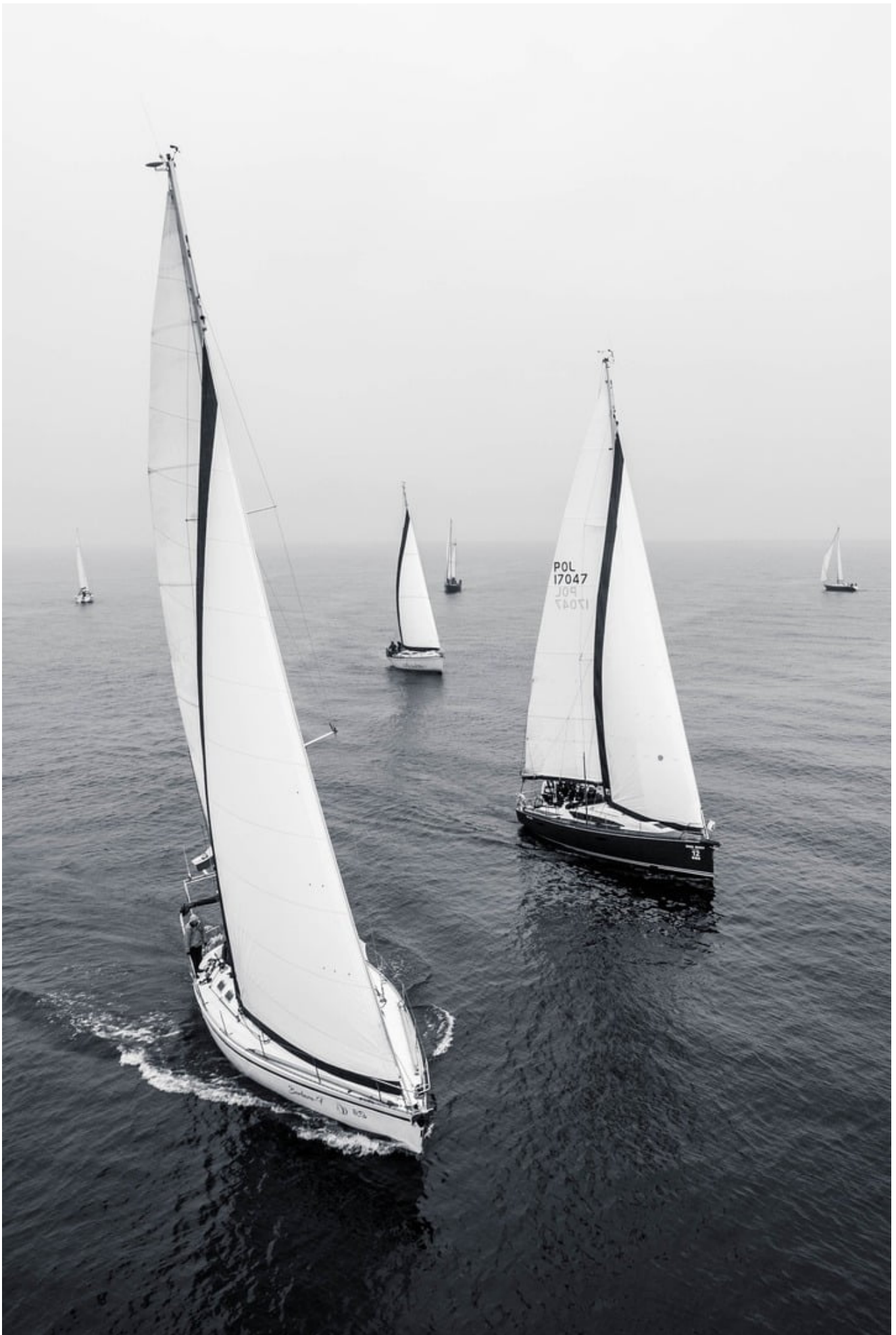
W miniony weekend odbył się drugi etap turystycznych Regat “Trzy Perły”. Tym