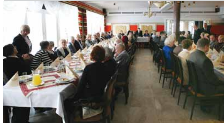
Po koncercie pionierzy i zaproszeni goście zjedli obiad, który zakończył się wspólnym śpiewaniem piosenek z czasów młodości naszych pionierów.

ulice obsługują głównie dojazdy do posesji prywatnych. Projekt techniczny przewiduje wykonanie zarówno nawierzchni tych trzech ulic jak i chodników z kostki betonowej. Po obu stronach jezdni zaprojektowano zjazdy do prywatnych posesji. Do odprowadzenia wód deszczowych zaprojektowano stosowną przepompownię. Przebudowę tych ulic planuje się rozpocząć po zakończeniu sezonu letniego.