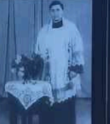
Opis: Działka Terlecki.