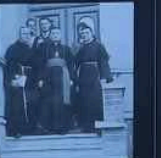
Planując franciszkański projekt nie na miejscu powstała w 1988 roku, ale w rzeczywistości franciszkański klasztor nie został odnowiony do czasu obecnych czasów.