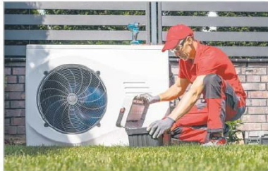
Nieuczciwe praktyki uderzają w najmniej zamożnych

Wśród wielu uczciwych firm zdarzają się oszuści, którzy namawiają do podpisania pełnomocnictwa i oferują teoretycznie „za darmo” zakup oraz montaż niedopasowanych do potrzeb i stanu technicznego domu pomp ciepła. Na podstawie podpisanej umowy, często bez wskazania w niej ceny usługi i produktu, przejmują dotację z programu „Czyste Powietrze”, który umożliwia prefinansowanie, czyli przekazanie dotacji bezpośrednio na konto wykonawcy. Potem montują niskiej jakości urządzenie i znikają, zostawiając beneficjentów z problemami serwisowymi. A rzetelne firmy, które od lat działają w sektorze pomp ciepła, nie podejmują się napraw takiego sprzętu.